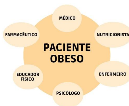
Figura 2: Integrantes de uma equipe multiprofissional no combate à obesidade

O propósito da equipe multiprofissional é fornecer apoio, ajuda e sanar todas as dúvidas, dificuldades que os pacientes possam ter sobre a sua condição e tratamento. Combater a doença da obesidade é um trabalho duro e precisará de muita dedicação, pois a doença afeta o bem-estar físico, social e psicológico, por isso o trabalho com todos esses profissionais visa criar programas dinâmicos e sempre atualizados para que os pacientes desenvolvam hábitos saudáveis e abandonem comportamentos nocivos. (DR FELIPE MALAFAIA, QUAL A IMPORTÂNCIA DA EQUIPE MULTIDISCIPLINAR NO TRATAMENTO DA OBESIDADE, 2020).