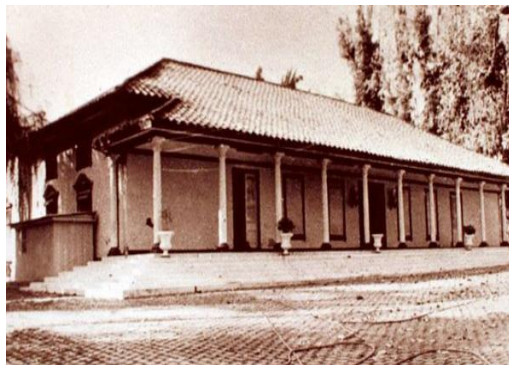
Figura 1: Villa Grimaldi antes de 1943 - época que foi centro de detenção e tortura