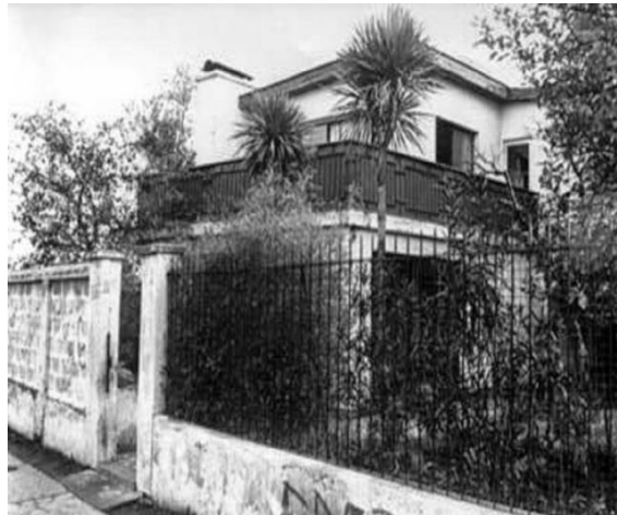
Figura 3: Venda sexy – Centro da DINA - Local de tortura

cachorro Volodia, da raça pastor alemão para estuprar presos políticos nos centros de detenção, os relatos descrevem, que detidos eram vendados para entrar no centro e serem violados sexualmente.