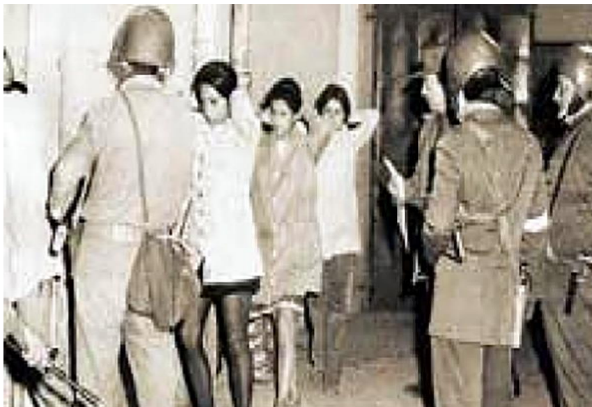
Figura 4: Mulheres sendo detidas por militares

Os relatos da Comissão Valech, cerca de 3.399 relatos de mulheres, inspirou o escritor Hopenhayn (2018), a escrever esse livro baseado nos relatos da Comissão Valech, com relatos de torturas e estupros, assédio sexual com cães, e a introdução de ratos vivos pela vagina e todo o corpo.