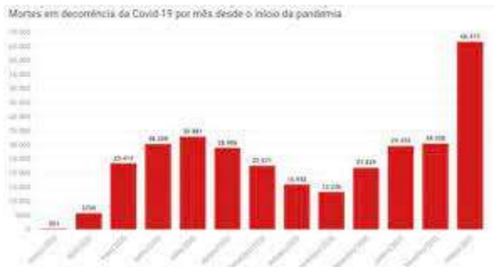
Figura 2: Comparação de mortes por Covid-19 por mês no Brasil.

O uso indiscriminado da Ivermectina põe em perigo a saúde das pessoas que utilizam a medicação de forma incerta, O Sistema Único de Saúde – SUS possui resultados bem-sucedidos do estudo in vitro, Movendo uma grande procura do medicamento e criação de protocolos de tratamento sem indícios clínicos e científicos. (Oliveira, 2020).