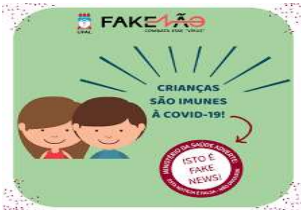
Figura 2 - Notícia falsa sobre a imunidade das crianças contra o novo coronavírus.