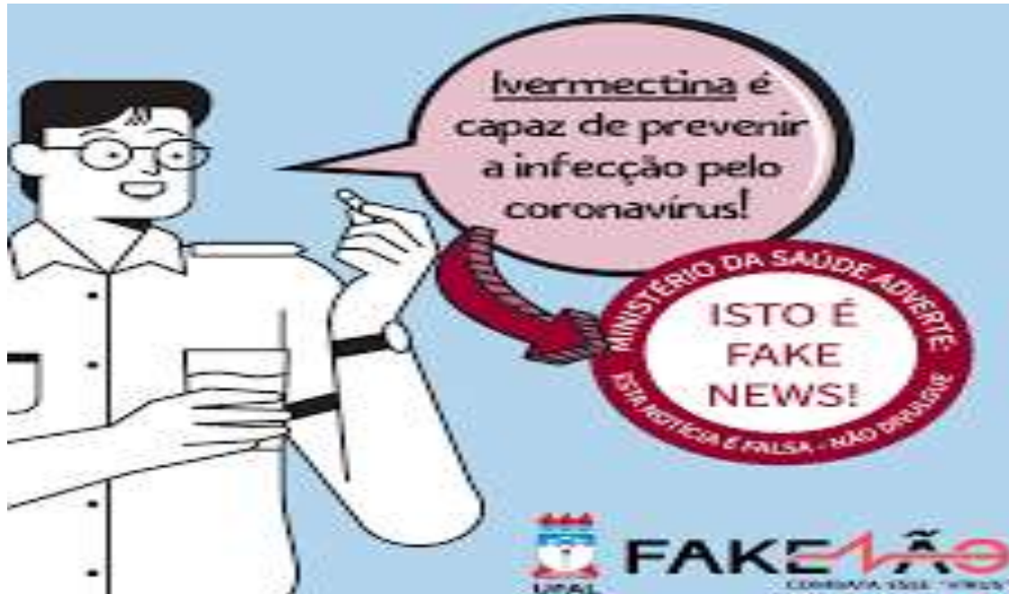
Figura 1 - Notícia falsa sobre utilização de Ivermectina como forma de prevenção da COVID-19.