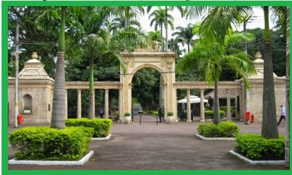
Figura 2 – Portal de Entrada do Jardim Zoológico do Rio de Janeiro.