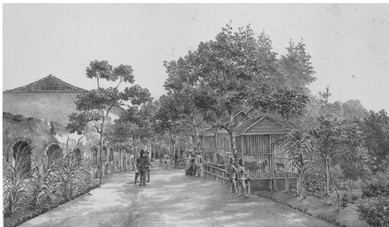
Figura 1. Chácara do Souto, com o Jardim Zoológico, Rio de Janeiro.