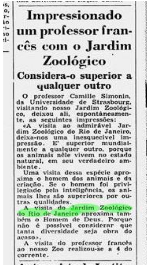
Diário de Notícias – 23/10/1952