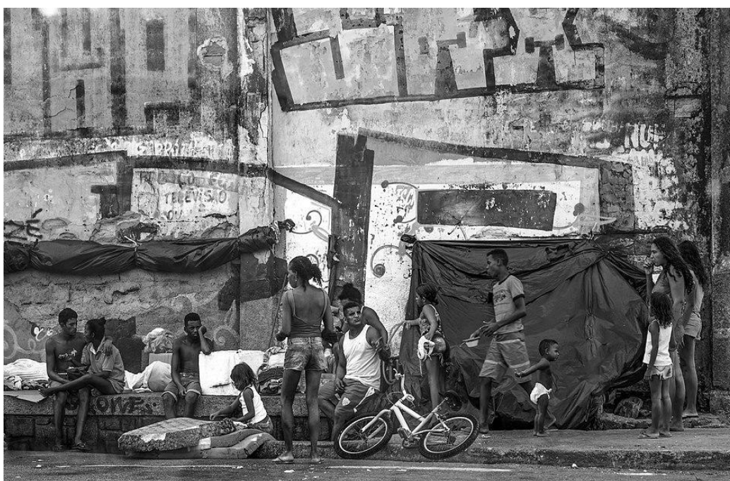
Figura 1 – Espaço urbano marcado pela precariedade, pela presença de sujeitos invisibilizados e pela produção social do medo.