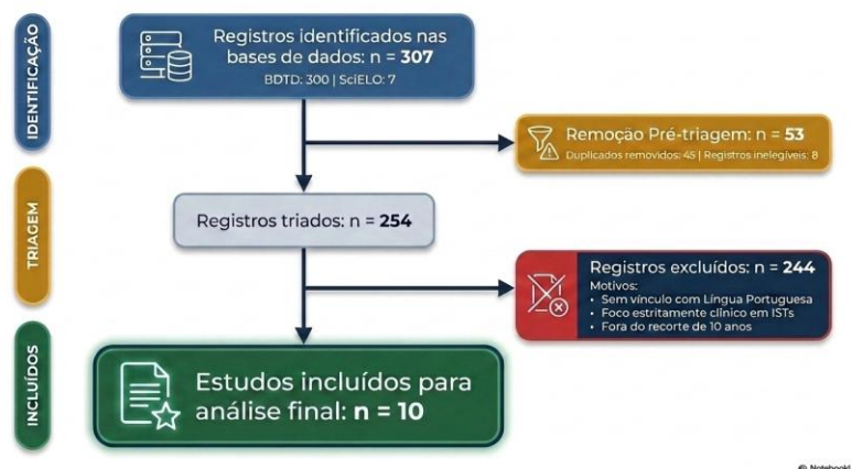
Figura 1- Roteiro de busca da revisão bibliográfica