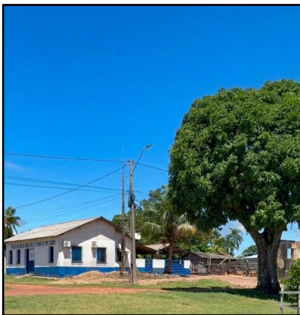
FIGURA 3: 12º PPD de Curuai

Contudo, há comunidades que margeiam o rio e a estrada, por exemplo, Curuai e Vila Socorro, que sediam Postos de Policiamento Destacado da Polícia Militar do Pará. Como se pode ver a seguir: