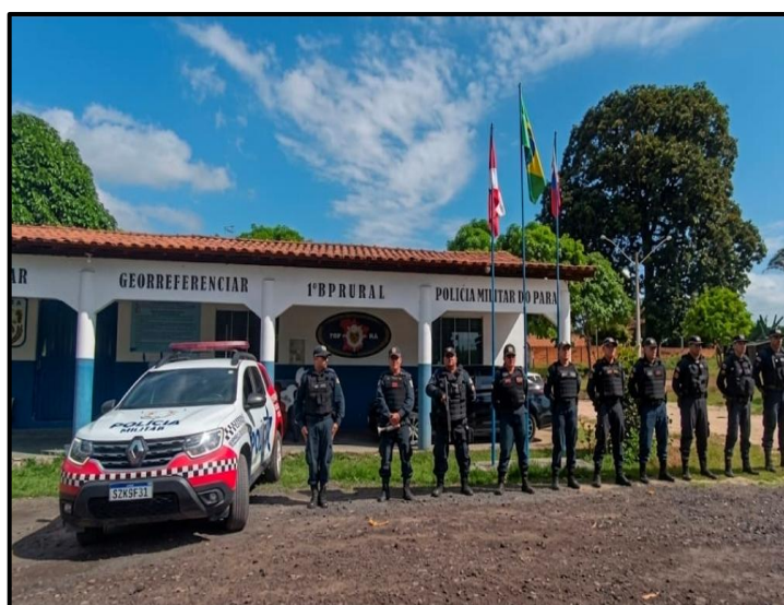
Figura 6: Batalhão de Policiamento Rural (1º BPR), localizado na Rodovia Transamazônica, em Marabá.