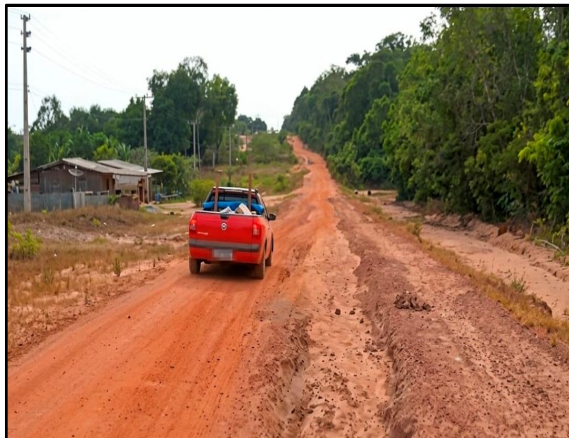
Figura 5: Rodovia Translagos (PA-257)

comunidades remotas, dificultam a chegada da PM ao destino das ocorrências. Na imagem a seguir, mostra-se a Rodovia PA-257, que liga o território de Santarém à cidade de Juruti: