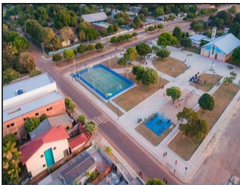
Figura 2: Praça Central da Vila de Curuai, Santarém-Pa.