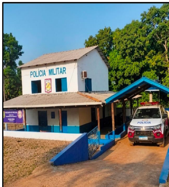
FIGURA 4: 141º PPD de Vila Socorro.