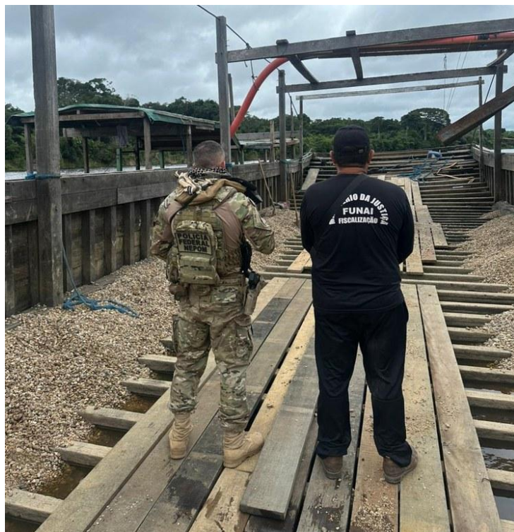
Figura 4-Fiscalização no Rio Guaporé, em Rondônia, durante operação contra garimpo ilegal.