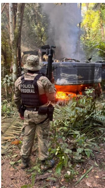
Figura 3- Operação Domo Amazônico contra garimpo ilegal em Terra Indígena Sete de Setembro.

Esses exemplos demonstram que a mineração ilegal em Rondônia afeta diferentes Terras Indígenas e não pode ser analisada apenas a partir de um caso específico. Trata-se de fenômeno regional, associado à pressão por recursos naturais, à fragilidade da fiscalização e à persistência de redes criminosas que atuam sobre territórios protegidos.