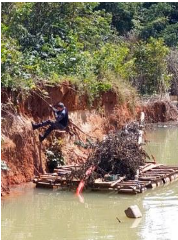
Figura 2- Ação do Ibama e da Polícia Federal contra garimpos ilegais em Terras Indígenas em Rondônia.

Em Rondônia, operações recentes do Ibama, Polícia Federal e Funai demonstram a permanência de garimpos ilegais em Terras Indígenas e áreas sensíveis. Em 2025, o Ibama informou que agentes do órgão e da Polícia Federal inutilizaram escavadeiras hidráulicas, motores estacionários, barco, balsa, óleo diesel e acampamentos utilizados na extração ilegal de ouro e cassiterita em Terras Indígenas de Rondônia. O mesmo informe registrou alertas de supressão de vegetação nativa e impactos relacionados ao modo de vida tradicional do povo Cinta Larga.