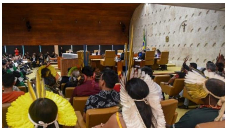
Figura 5- Julgamento do marco temporal no Supremo Tribunal Federal.