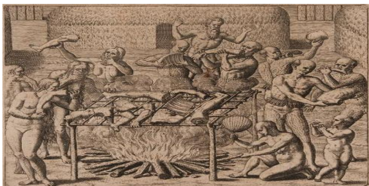
Figura 7 - Representação artística de perspectiva européia sobre o ritual antropofágico

Fonte: Theodor de Bry (1596) Theodore de Bry e as primeiras imagens do Brasil , 2017