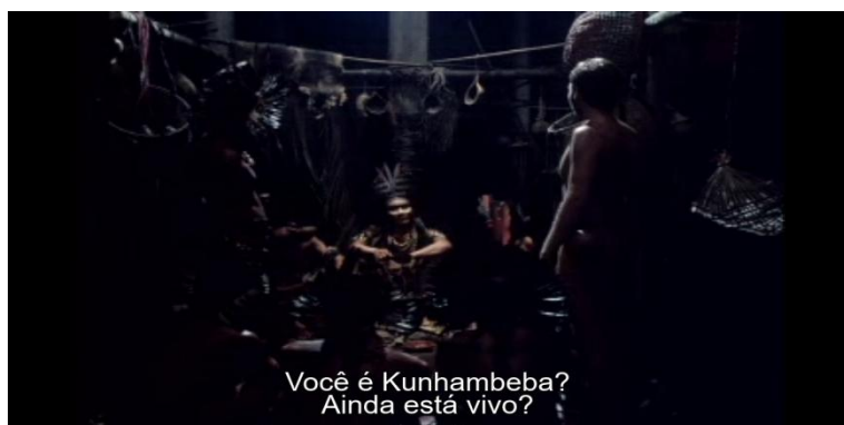
Figura 6 - Cena do encontro entre Hans Staden e o Chefe Cunhambebe