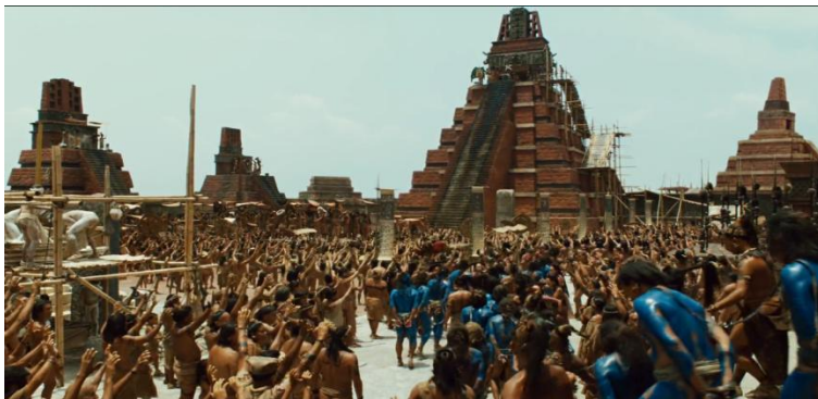
Figura 1 – Cena focando várias pirâmides de uma cidade maia fictícia

tempo em nome de seus valores foram referenciados no filme Apocalypto . Ainda no início do seu enredo, quando os protagonistas não pertencentes a uma comunidade estatal são capturados por militares maias e levados em cativeiro para uma cidade, é possível visualizar um cenário contendo pirâmides estruturalmente semelhantes as que são encontradas nas ruínas da antiga cidade de Tikal, atual Guatemala.