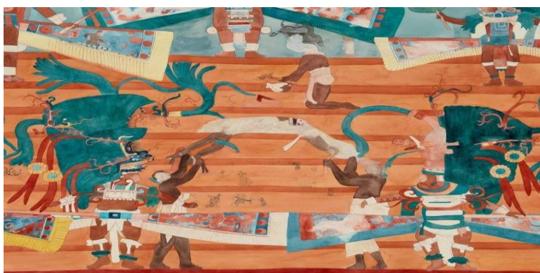
Figura 4 - Pintura de um sacrifício maia