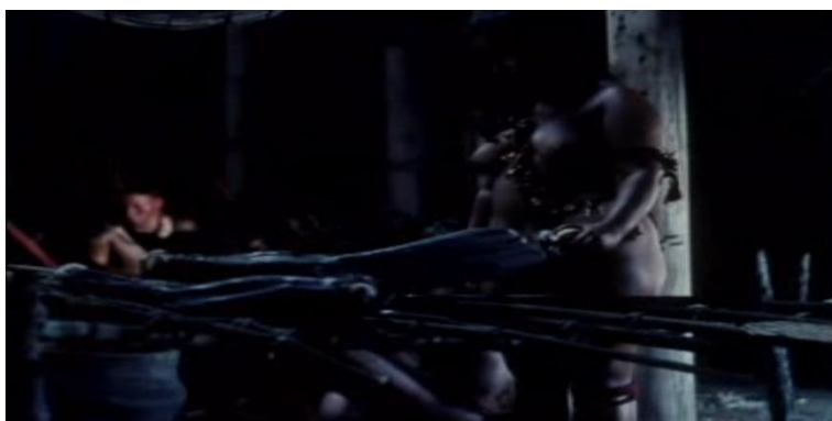
Figura 8 - Cena de uma aldeã observando pernas humanas prontas para serem comidas

Fonte: Theodor de Bry (1596) Theodore de Bry e as primeiras imagens do Brasil , 2017