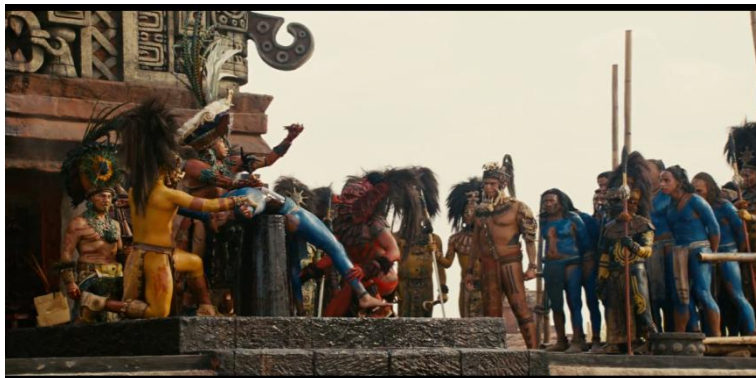
Figura 3 - Cena do sacerdote erguendo o coração após um sacrifício