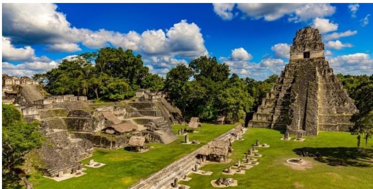
Figura 2 - Ruínas contemporâneas da cidade de Tikal