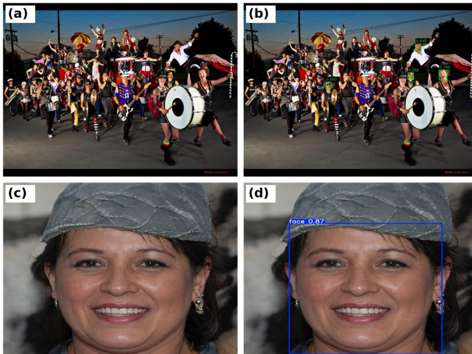
Figura 2 – Resultados qualitativos do Experimento 2. (a) imagem original do WIDER FACE, (b) resultado da detecção no WIDER FACE, (c) imagem original do AI FACE DATASET e (d) resultado da detecção no AI FACE DATASET.