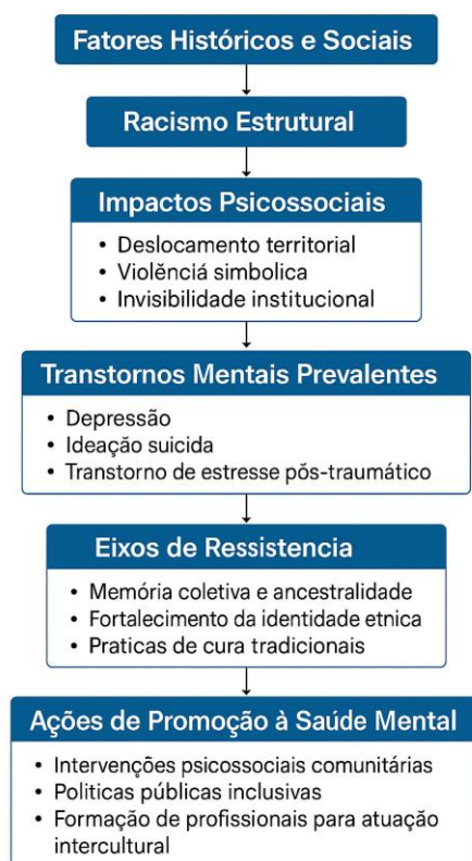
Figura 2 - Determinantes e Respostas à Saúde Mental Indígena