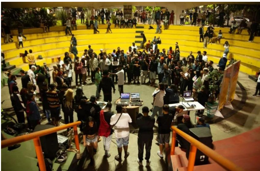
Imagem 3: Ocupação cultural da rua por práticas artísticas periféricas

As batalhas de rima, os saraus e as rodas culturais também demonstram como a palavra pode produzir território. Nesses espaços, a oralidade se torna prática estética e política. A rima improvisada, o poema declamado, a narrativa de vida e a escuta coletiva transformam a rua em ambiente de produção de pensamento e reconhecimento social. Muitas vezes, esses encontros ocorrem em praças, esquinas, escolas, centros comunitários ou espaços públicos sem grande estrutura formal, mas carregados de significado para os participantes. A partir da perspectiva de Certeau (1994), é possível compreender essas práticas como táticas cotidianas de apropriação do espaço, pois os sujeitos reinventam os lugares disponíveis e produzem novos usos para a cidade.