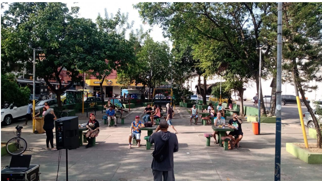
Imagem 1: Apropriação cultural e cotidiana do espaço público periférico

É nesse ponto que o corpo se torna elemento político da paisagem urbana. A presença de corpos periféricos em espaços públicos, especialmente quando associada à arte, à juventude, à estética e à coletividade, questiona a ideia de que a cidade pertence apenas a determinados grupos sociais. Serpa (2007) destaca que o espaço público nas cidades contemporâneas é atravessado por desigualdades, controles e formas seletivas de acesso. Nas periferias, essa disputa aparece tanto na ausência de equipamentos adequados quanto na criatividade com que os sujeitos reinventam os espaços disponíveis. Quando uma praça sem estrutura se transforma em ponto de encontro, quando um muro se torna suporte de memória visual ou quando uma rua vira espaço de dança, lazer ou celebração, ocorre uma apropriação simbólica e cultural do território.