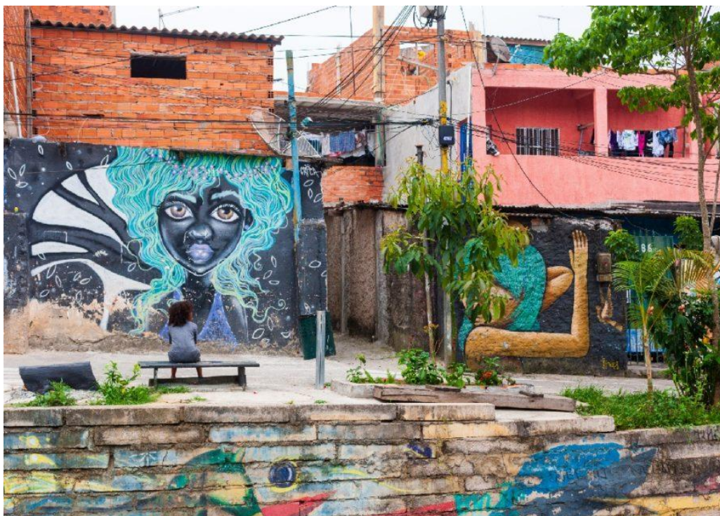
Imagem 2: Grafite como forma de apropriação simbólica do espaço urbano

O grafite é uma das manifestações mais expressivas dessa disputa simbólica. Em muitos contextos, o muro aparece como fronteira, separação ou marca de abandono. Entretanto, quando apropriado pela arte urbana, ele se transforma em superfície de memória, denúncia, identidade e visibilidade. O grafite pode denunciar violências, homenagear moradores, afirmar identidades negras e periféricas, registrar símbolos locais ou simplesmente produzir beleza em espaços negligenciados pelo poder público. Nessa perspectiva, a arte visual urbana funciona como escrita territorial, pois inscreve no espaço marcas de presença e pertencimento. Claval (1999) contribui para essa leitura ao demonstrar que a cultura participa da organização simbólica dos lugares, permitindo que os grupos humanos atribuam sentido às paisagens que constroem e habitam.