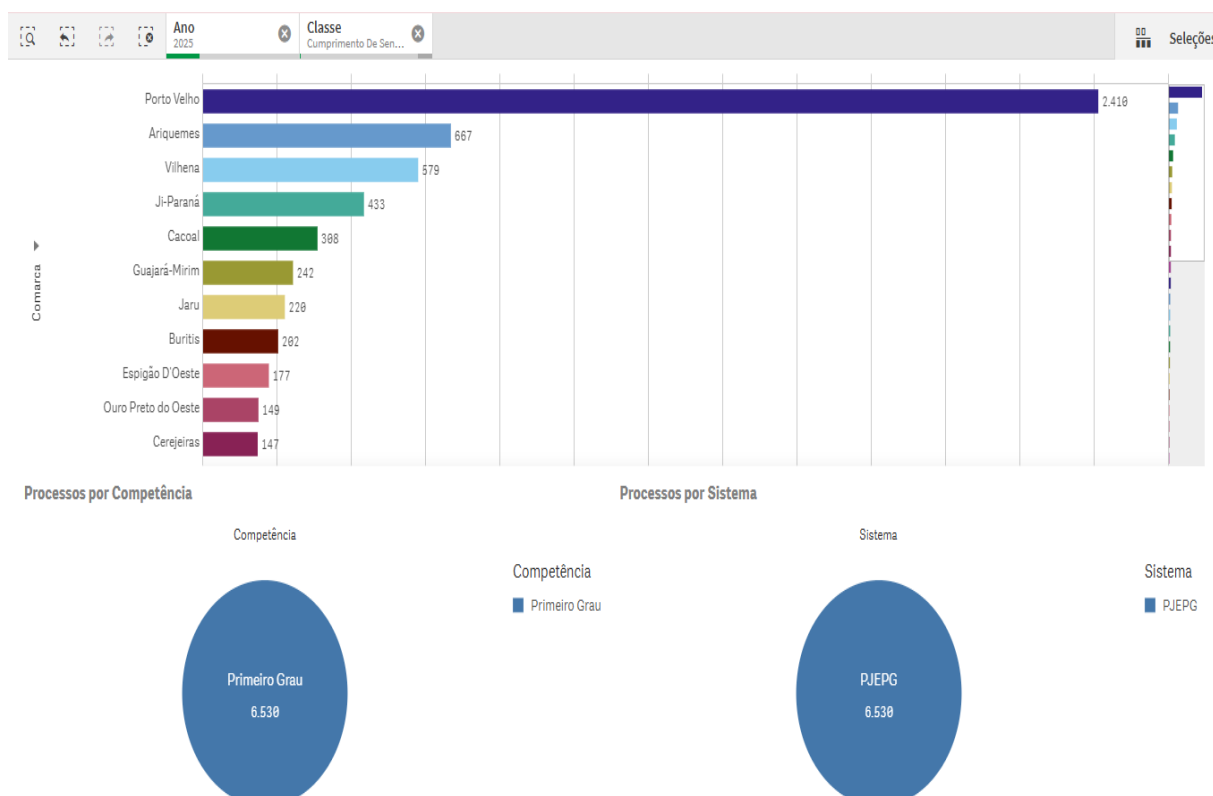
Imagem 02- processos por comarca ou órgão julgador e por competência