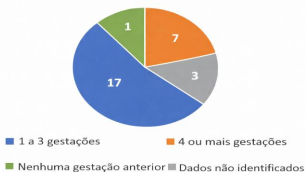
Número de Gestações das Mulheres Privadas de Liberdade