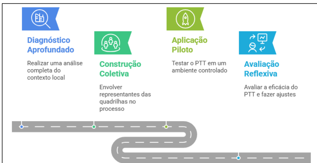
Figura 01: Processo de Desenvolvimento do PTT