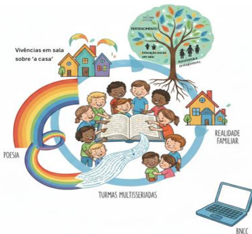
Figura 2 - Teia de aprendizagens compartilhadas: da fluência leitora ao pertencimento Social.