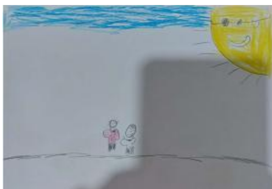
CRIAN7 – Ante da atividade