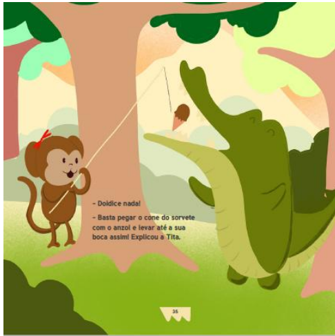
Figura 3. A solução encontrada pela amiga A solução encontrada pela amiga