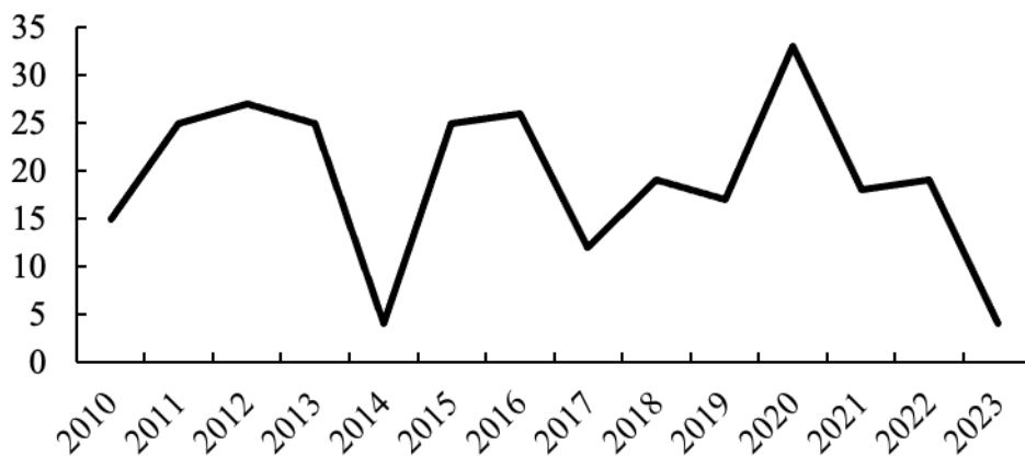
Figura 2. Número de trabalhos publicados sobre pesca artesanal entre 2010 e 2023.

ambientais retratados aqui, foram utilizados os relatórios do IPCC, sobretudo o quinto relatório, e no primeiro relatório de avaliação nacional do PBMC e Instituto Nacional de Pesquisas Espaciais (INPE).