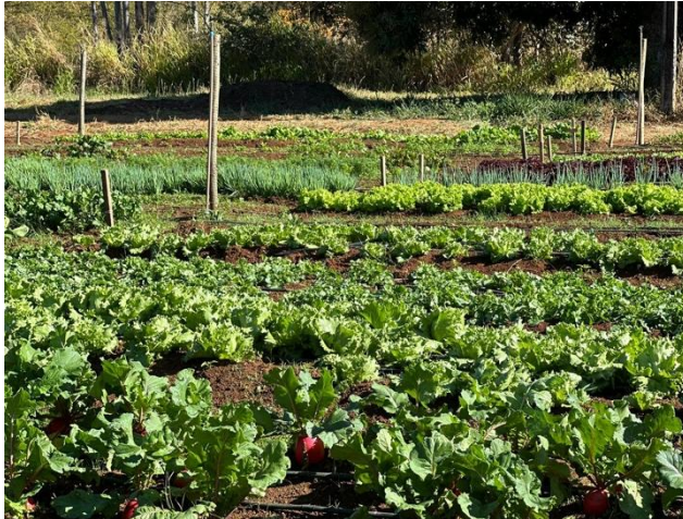
Figura 02 – Horta após etapa de implantação e integração do sistema de irrigação automatizado.

do curso Técnico em Redes de Computadores Integrado ao Ensino Médio, que contribuíram ativamente para o crescimento do projeto (Figura 02).