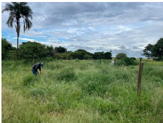
Figura 01 - Preparo do solo para receber as mudas e sementes.

No que se refere ao cronograma do projeto, as atividades previstas para os cinco primeiros meses do ano somente puderam ser efetivamente implementadas ao final de maio, em virtude de entraves relacionados à obtenção de apoio financeiro e às demandas logísticas para aquisição da matéria-prima. Superadas essas limitações, foi dado início ao preparo do solo (Figura 01), etapa que envolveu práticas de adubação, correção do solo e organização dos canteiros, com vistas a assegurar condições adequadas de fertilidade e estrutura para o recebimento das primeiras sementes e mudas, garantindo o desenvolvimento saudável das culturas planejadas.