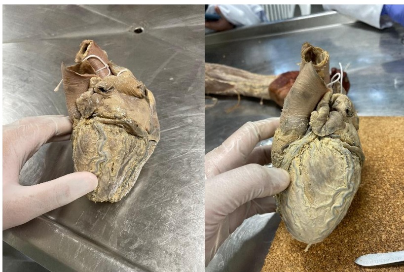
Figura 3 - Registros do coração depois de ser dissecado