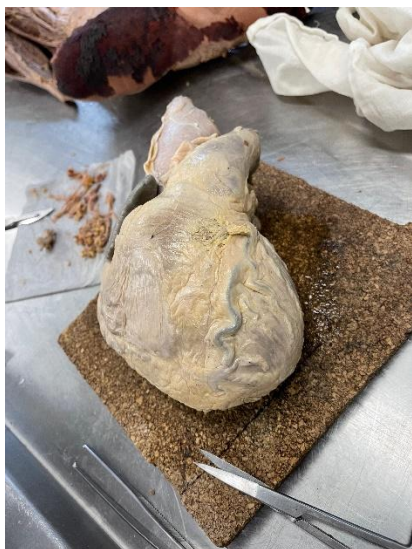
Figura 2 - Registro do coração antes de ser dissecado