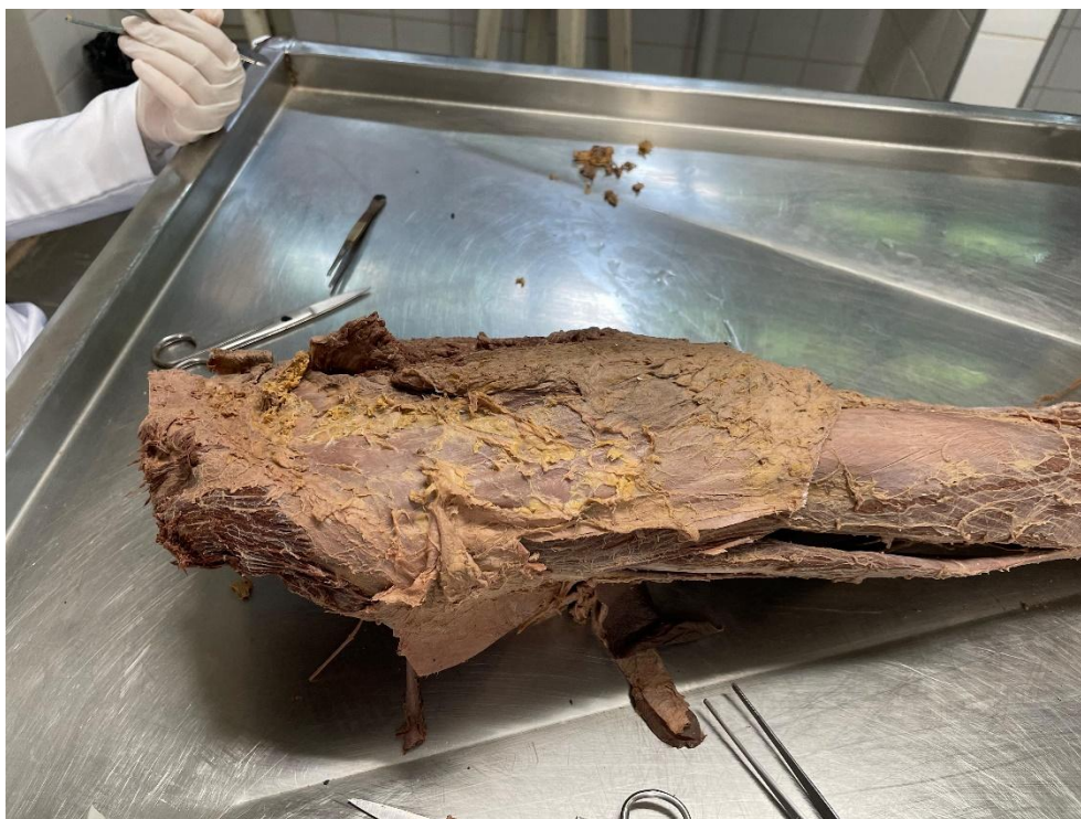
Figura 4 - Registros do membro inferior dissecado