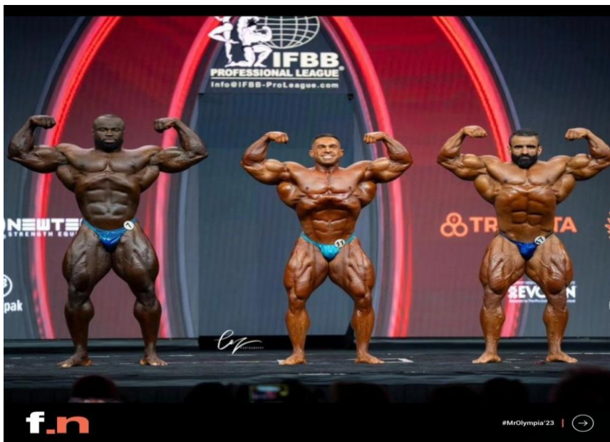
Figura 02: campeonato de fisiculturismo ifbb 2023