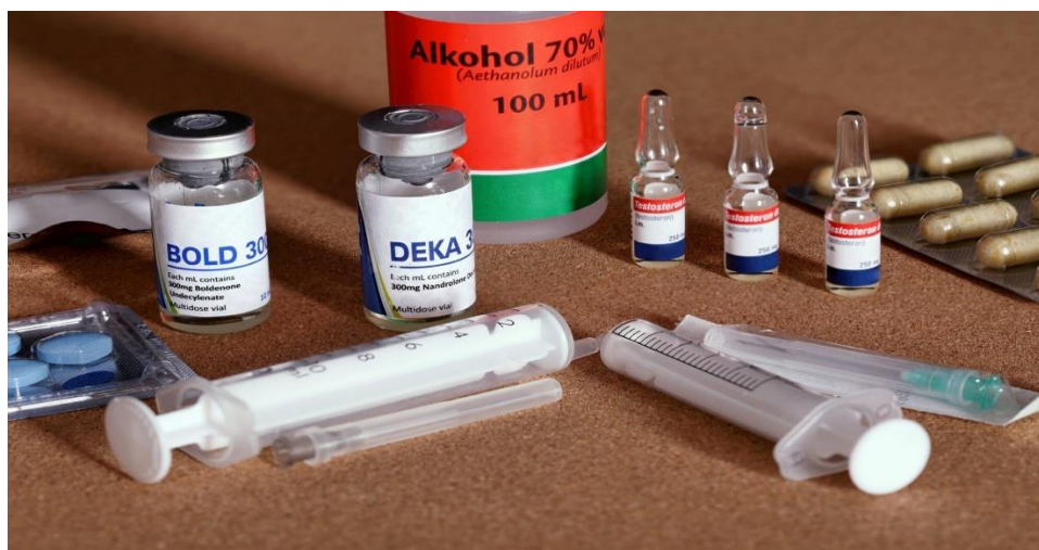
Figura 01: anabolizantes mais utilizados para o ganho de massa

A combinação desses ésteres resulta em uma liberação gradual de testosterona no corpo, permitindo que os efeitos anabolizantes sejam mantidos ao longo de um período mais longo do que o uso de testosterona de ação curta ou de vida útil mais curta. (Pereira J. E. T.; Silva C. T. X.)