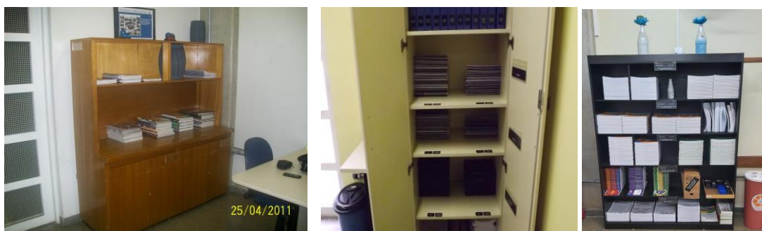
Figura 8 – Armário, arquivos de documentações: Antes e o Depois