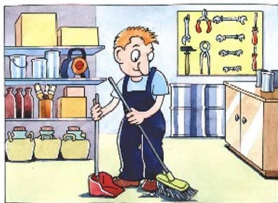
Figura 3 – Seiso: Senso de limpeza

Fonte: Disponível em: https://www.linkedin.com/pulse/5s-seiso-senso-de-limpeza-t%C3%A2mcarli-mota/?originalSubdomain=pt