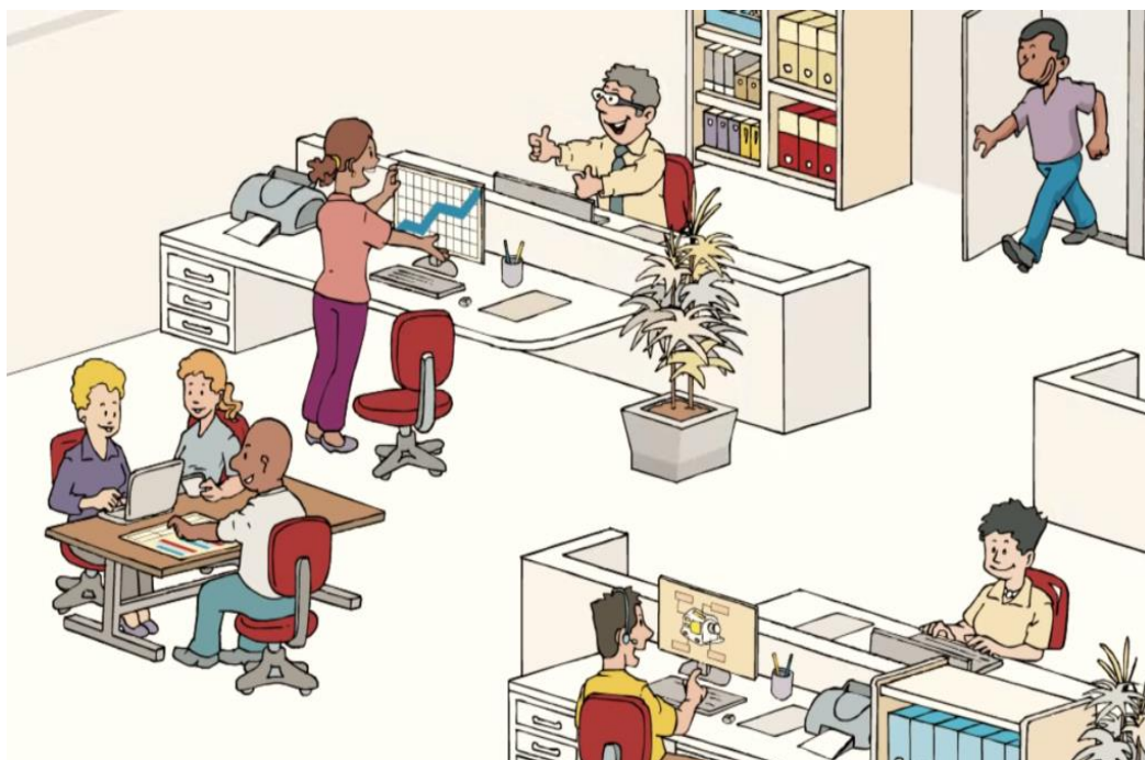
Figura 5 – Shitsuke: Senso de Autodisciplina