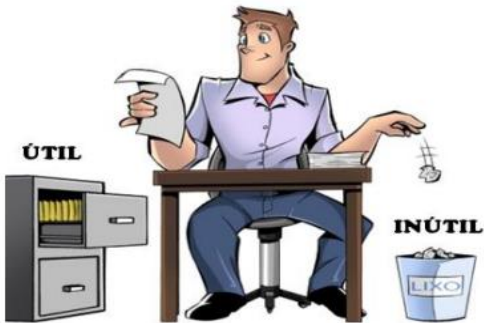
Figura 1 – Seiri: Senso de utilização