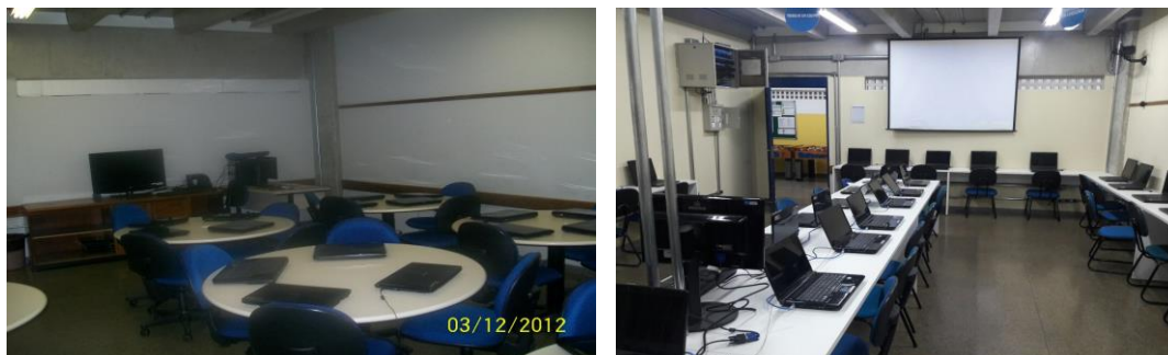
Figura 7 – Sala de Informática: Antes e o Depois