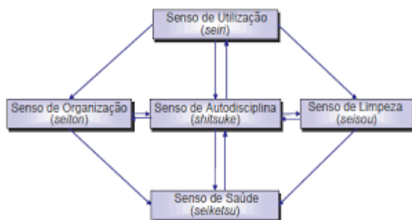
Figura 6 – O 5S como um sistema