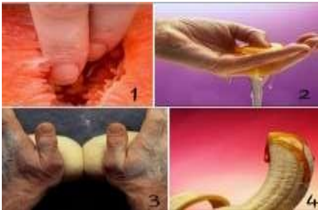
Imagem I: (fotos utilizadas no formulário, para serem analisadas e, com isso, responder à 3ª questão)